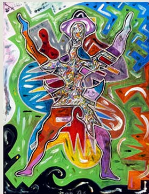
oben rechts / grün - schwarz