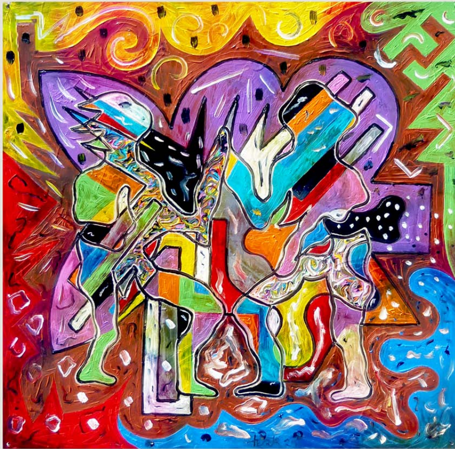
Anima und Animus tanzen durchs Niemandland / 60,5 x 60,5 cm