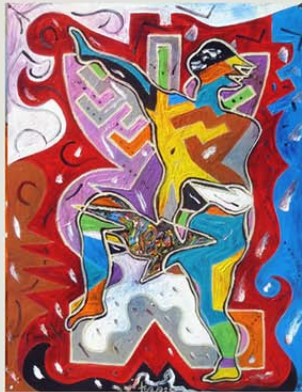
oben links / rot- gelb