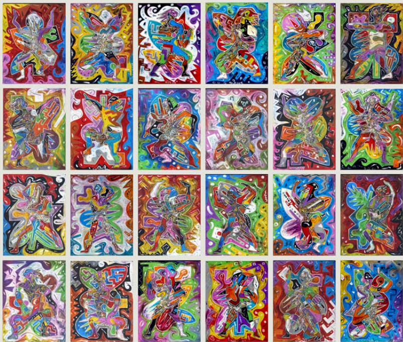
Niemand ertanz das Niemandland / 24teilig / 251 x 213,5 cm / Teil 39,75 x 51,5 cm