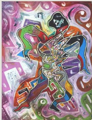
mitte oben / weiß - blau